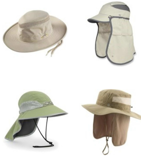
شکل ۵. نمونه ای از کلاه های مناسب مورد استفاده جهت محافظت در برابر پرتوهای فرابنفش