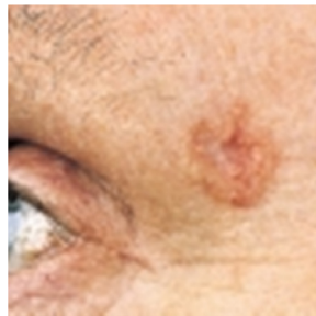
شکل ۱. شمایی از سرطان سلول های پایه (BCC)

شیوع NMSC به بیش از دو برابر افزایش یافت. در مطالعه ای دیگر خطر ابتلا به NMSC با توجه به قرار گرفتن شخص در معرض خورشید مورد بررسی قرار گرفت و نشان داده شد که در بخش هایی از بدن مانند گوش ها، صورت، گردن، ساعد و بازوها که معمولاً در معرض پرتوهای فرابنفش هستند NMSC شایع تر است. این به این معنی است که در طولانی مدت، تکرار مواجهه با پرتوهای فرابنفش، عامل اصلی ابتلا به NMSC می باشد. در برخی از کشورها رابطه ای مشخص بین افزایش بروز NMSC با کاهش عرض جغرافیایی (یعنی افزایش میزان پرتوهای فرابنفش) وجود دارد. سرطان سلول های بازال (BCC) (شکل ۱) شایع ترین نوع سرطان پوست به شمار می آید و نسبت به دیگر اشکال سلول های سرطانی پوست خطر کمتری دارد. سرطان سلول های بازال که در لایه اپیدرم (لایه خارجی پوست) قرار دارند سرعت رشد آرامی داشته و به ندرت گسترش می یابند. افرادی که پوست و موی روشن و چشم آبی، سبز و یا خاکستری دارند و همچنین اشخاصی که مشاغل آنها در فضای باز است و به طور متوالی در معرض پرتوهای فرابنفش هستند نیز از خطر بیشتری برای ابتلا به BCC پوست برخوردارند.