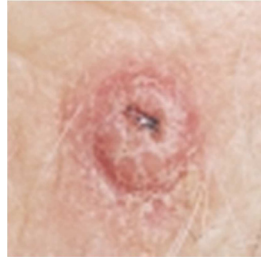
شکل ۲. شمایی از سرطان سلول‌های سنگفرشی (SCC)